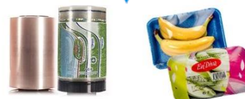
Film stretch neutri e stampati