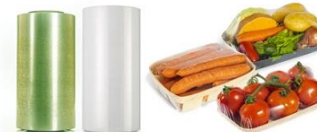
Film stretch neutri certificati «bio-based» & compostabili