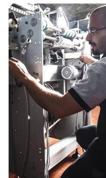
Manutenzione & Assistenza Ricambi